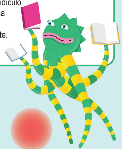
Ilustración de aliteración. Inventar algún trabalenguas ridículo y dibujar alguna ilustración correspondiente.

Usar tiza para escribir mensajes en la vereda para los que pasen por ahí.